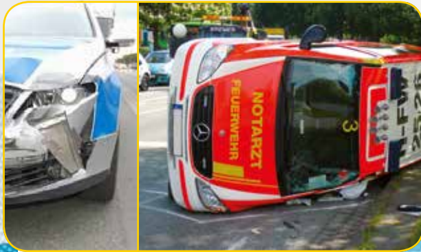
Das Ende einer Einsatzfahrt.

Bundesweit gibt es jährlich allein im Rettungsdienst über 10 Millionen Einsatzfahrten. Hinzu kommen die Einsätze von Feuerwehr und Polizei.